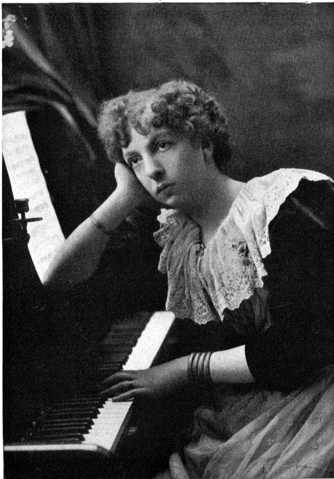
D'APRÈS UN PORTRAIT DE H.-S. MENDELSSOHN